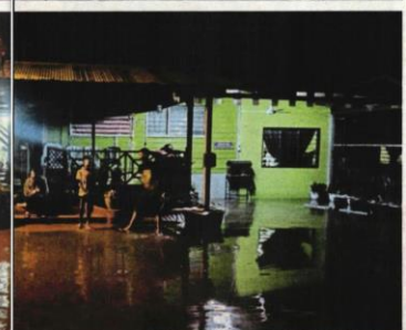
Kediaman rumah di PPRPT Panchor, Pantai Remis di Manjung yang dilanda banjir kilat susulan air pasang besar, malam tadi.