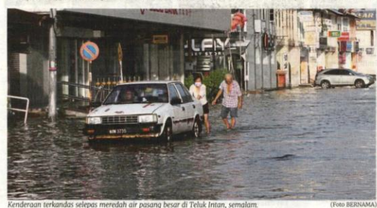
Kenderaan terkandas selepas meredah air pasang besar di Teluk Intan, semalam.