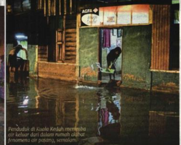
Penduduk di Kuala Kedah memba air keluar dari dalam rumah akibat fenomena air pasang, semalam.